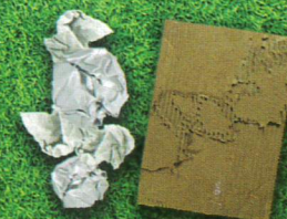
carta e cartone